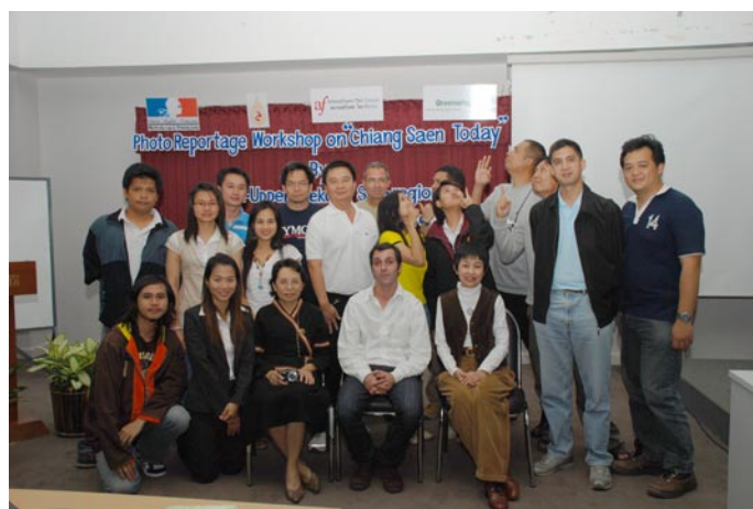
Atelier Photo-reportage "Chiangsaen aujourd'hui" animé par Nicolas Pascarel, du 21 au 26 juillet 2007, à l'université MFU, Chiangrai.