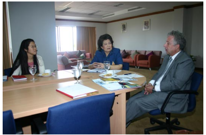
วันที่ 28 กุมภาพันธ์ 2551 นายฟิลิป ติแยส ที่ปรึกษาฝ่ายวัฒนธรรมและความร่วมมือ เดินทาง มาเยือนมหาวิทยาลัยแม่ฟ้าหลวง และเยี่ยมชมหน่วยความร่วมมือทางวิชาการฝรั่งเศสฯ