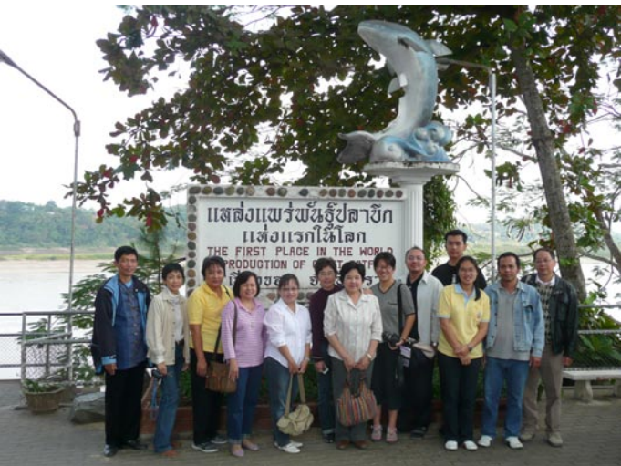
โครงการสัมมนาวิชาการเรื่อง "วัฒนธรรมไทในสิบสองปันนา" หน่วยความร่วมมือทาง วิชาการฝรั่งเศสฯร่วมกับคณะกรรมการสภาวิจัยแห่งชาติ สาขาปรัชญา วันที่ 25-26 ธันวาคม 2550 ณ มหาวิทยาลัยแม่ฟ้าหลวง จังหวัดเชียงราย