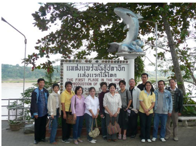
Les 25 et 26 Décembre 2007, le Séminaire "La culture Thaïe dans le Sibsongpanna", organisé par le Centre FHM.