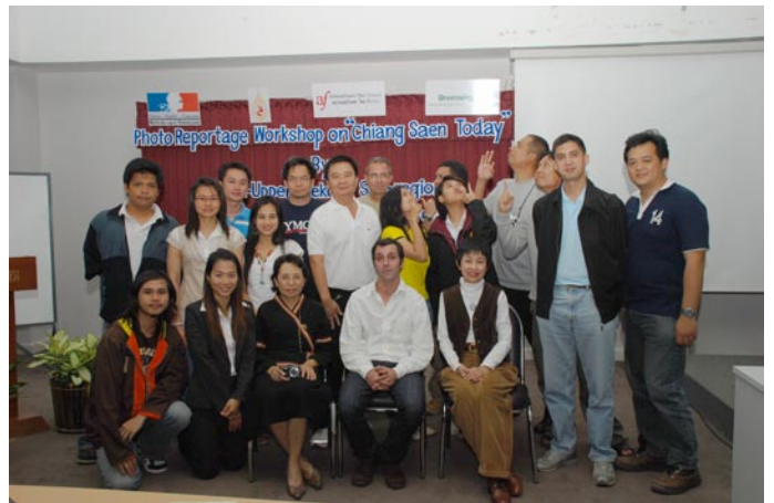
โครงการ อบรมเชิงปฏิบัติการ การถ่ายภาพแนวสารคดี ในหัวข้อ "เชียงแสนวันนี้" โดย Mr.Nicolas Pascarel ในวันที่ 21- 26 มกราคม 2550 ณ มหาวิทยาลัยแม่ฟ้าหลวง จังหวัดเชียงราย